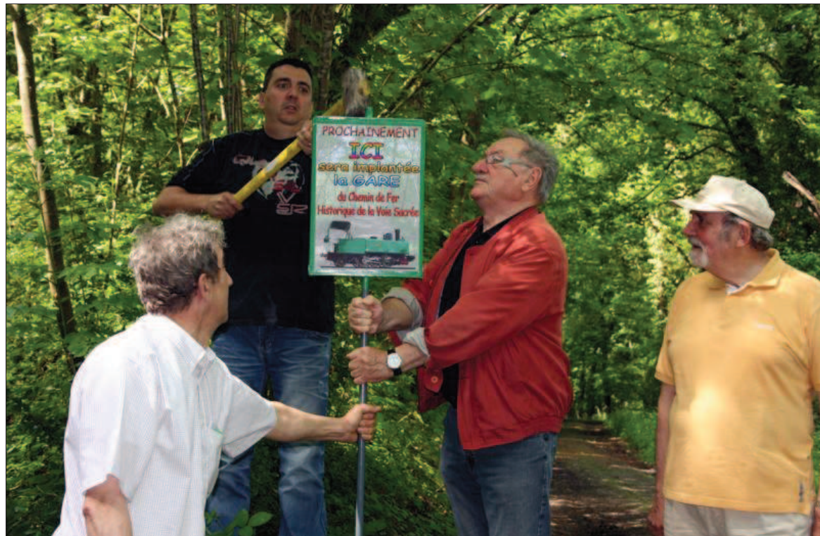
■ Pour marquer cette nouvelle avancée dans leur projet, les bénévoles sont allés planter leur premier poteau informatif.

Depuis l'inauguration de la vieille loco restaurée en 2008 au terme de 50.000 heures de travail, et quelques sorties sur un porte-engin, le temps s'était comme figé dans les locaux de l'association. Enfin presque, puisque les bénévoles n'ont pas manqué d'idées pour faire entrer de l'argent dans les caisses. « Nous avons lancé une souscription, les donateurs peuvent acheter des mètres de voie, aujourd'hui il reste un quart des 4,2 km à parrainer. Les rails nous les avons. » Ne manquait donc que des subventions pour passer à la nou-